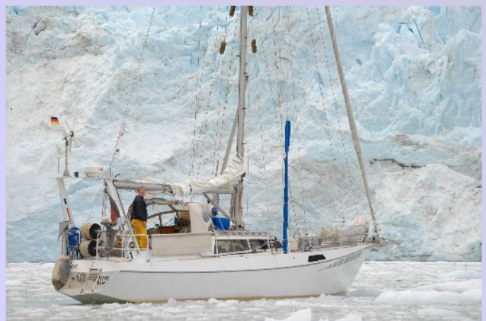
Vier mal Aspekte des Seno Pia. Keine Frager, dass wir darauf anstoßen müssen.