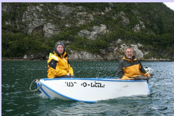
Bestens für diese rauen Bedingungen geeignet: Unser unscheinbares Banana-Boot hat sich bewährt.