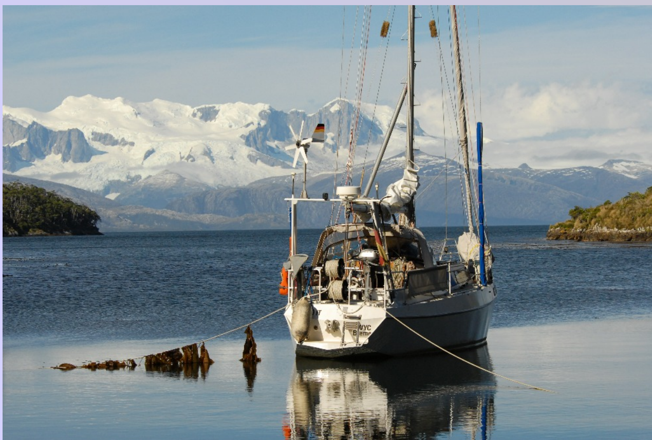
Mit Landleinen und Anker in Caleta Alakush. In der Ferne grüßen die verschneiten Gipfel der Darwin-Kordillere. Die Bucht ist wegen der Fallböen verschneien. Das Foto deutet allerdings an, wenn man tief genug hineinkriecht, liegt man im Etenteich. Der Wind gelangt erst ein paar Meter vor dem Boot auf den Grund. Hier allerdings bei moderaten Bedingungen.