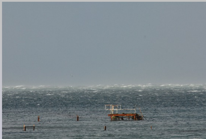
Kap Hoorn meldet 90 Knoten Wind. Der Beagle-Kanal wird von aufgepeitschter Gischt bestimmt: 60 Knoten weht es. Das gegenüberliegende Ufer ist unsichtbar von unserem Standort in Puerto Williams. An unserem Liegeplatz ian der CONTRAMAESTRA MICALVI weht es erfreulicherweise nur mit bescheidenen 30 Knoten.