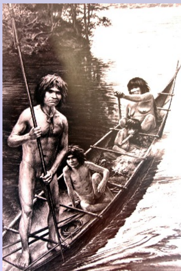
Wie konnten die Feuerländer seinerzeit nur nackig unter diesen Bedingungen existieren?

Hafenkapitän an. Der gibt Entwarnung. Nein, nein, wir sollen mal ruhig kommen. Der Hafen ist wegen des Wetters für auslaufenden Verkehr gesperrt, hinein dürfen wir. So wird unser Tatendrang also gleich wieder gebremst: Die nächsten Tage weht es weiter heftig aus West, und nach Westen wollen wir. Keine Chance, auch nur einen Meter gut zu machen. Geschweige, dass uns die Offiziellen aus dem Hafen ließen. Die fünftägige Zwangspause verbringen wir mit Spaziergängen und Wanderungen in der Umgebung (nur nicht in den Wald, da purzeln die Bäume), einem Besuch der Siedlung, in der die letzten Nachkommen des Yahgan-Volkes leben, und zahlreichen Aufenthalten in der berühmten Bar der CONTRAMAESTRE MICALVI. Bei Pisco Sour trifft man sich hier mit anderen Seglern und Globetrottern, und wenn man Glück hat, kehrt ein Boot aus der Antarktis zurück und bringt Antarktiseis zur Verfeinerung der Getränke.