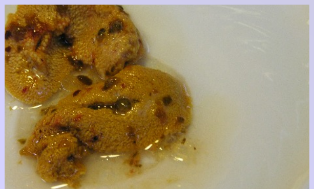
Oben wird eine Centolla zerlegt, in der Mitte der Centolla-Salat und unten Seeigelrogen mit Zitronensaft.