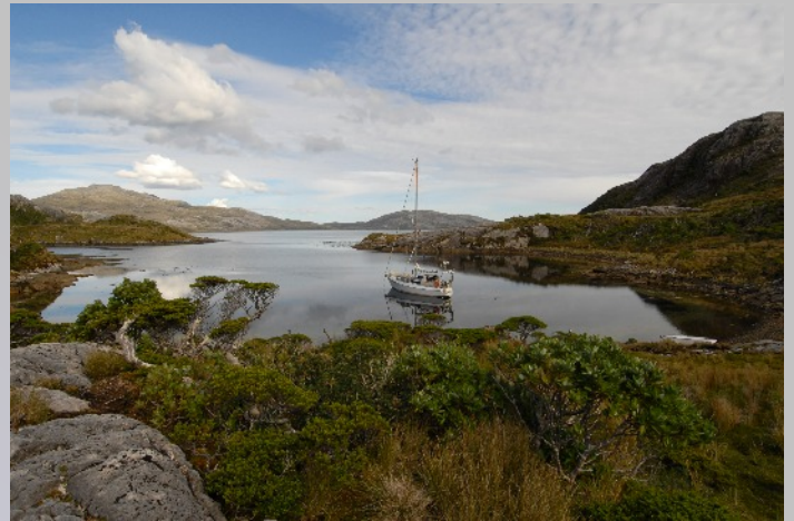
JUST DO IT tief hineingeschlüpft in die Caleta Brecknock.