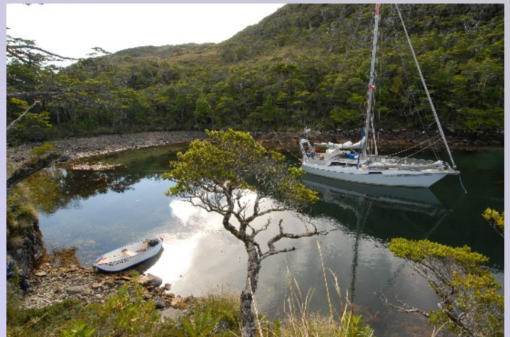
Das Foto verdeutlicht, wie tief wir in die Caleta Alakush gekrochen sind. Vom Ufer trennt uns achtern nur wenig mehr als eine Bootslänge.

Caleta Alakush entpuppt sich als wahres Kleinod. Die Sonne zeigt sich, kaum dass das Boot vertäut ist, und vor uns öffnet sich eins der beeindruckendsten Panoramen des Beagle-Kanals: Unsere liebeliche Bucht mit überhängenden Bäumen, das Inselchen in der Einfahrt, der Brazo und als Abschluß die schneebedeckte Darwin-Kordillere. Wir setzen uns zum Genießen ins Cockpit. Dann ein erster Landausflug. Die Vögel sind so wenig an Menschen gewöhnt, dass sie neugierig kommen um zu schauen, wer sich hier her gewagt hat. Vor unseren Füßen hüpfen sie herum und suchen Futter. Die großen Kingfisher fliegen uns lautstark krächzend geradezu um die Ohren. Wir schleichen durchs Gebüsch, durch Farne, Flechten, Unterholz, bewundern die Fülle der Pflanzenwelt und an den sonnigen Hängen entdecken wir die rote Blüten der Coicopihue, der Nationalblume Chiles.