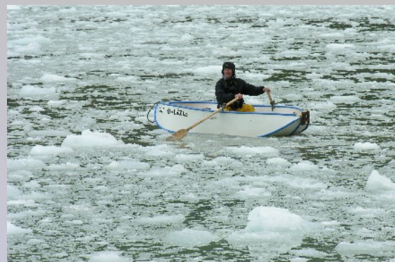
Eisrudern mit Banana-Boot