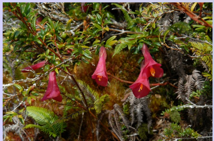
Blüten der Cocopihue, der Nationalblume Chiles.