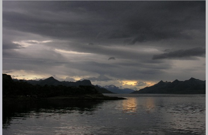
Abendstimmung über der Caleta Silva.

„Ich kann denen doch nicht verwehren, längsseits zu kommen.“